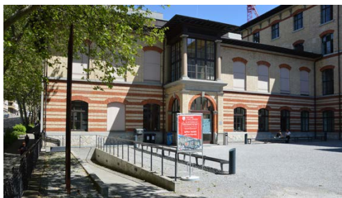
Oben: CAB Kiesplatz links Rampe Unten: CAB Kiesplatz rechts