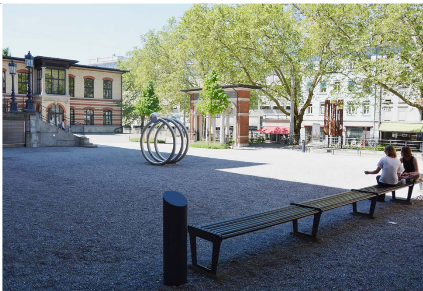
CAB Kiesplatz links

ETH Zürich Abteilung Campus Services Bewilligungen Binzmühlestrasse 130 8092 Zürich